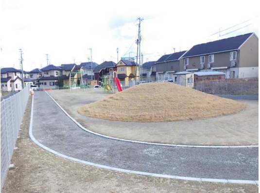
園路施工(路盤工)状況(東側を望む)