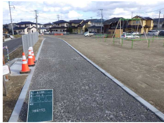
園路施工(路盤工)状況(東側を望む)