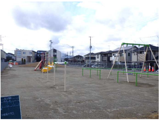
ベンチ及び遊具設置状況(西側を望む)

1月は、園路の施工(路盤工)及び水飲み場設置を行いました。 2月は、引き続き、園路の施工を行い、中木植栽を行います。