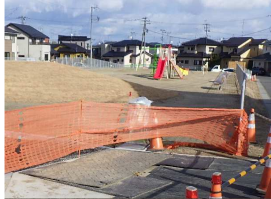
水飲み場設置状況(東側を望む)