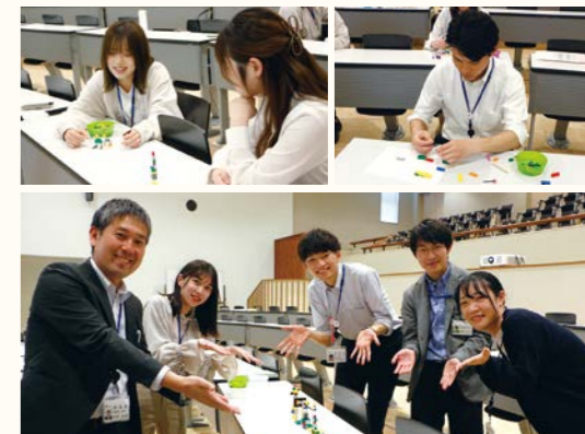
レゴブロックを使用したコミュニケーション能力向上研修の風景

経験年数や役職に応じて、各職員に求められる役割は様々です。与えられた役割を担うための能力を身に付けるため、郡山市では階層別に多種多様な研修を実施し、職員の成長を全力で応援しています。研修では同期入庁職員や他自治体の職員と共に研修をすることでとてもよい刺激を貰います。