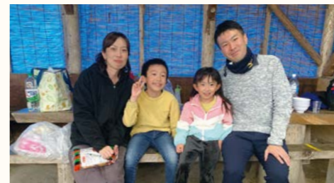
家族でバーベキュー