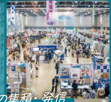
#産業の集積・発信