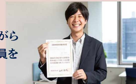
基本情報処理技術者試験合格証