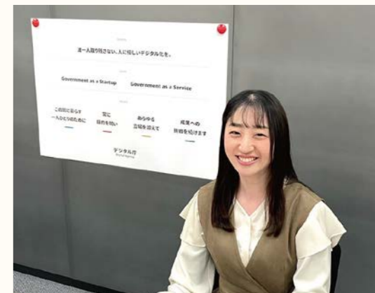
デジタル庁への派遣

郡山市では、中央省庁や福島県関係機関、外部研修機関(自治大学校や市町村アカデミー)等に職員を派遣しています。異なる組織での異なる業務遂行は、自治体職員にとって多様な経験・知識を習得する貴重な機会です。派遣された職員からは「様々なバックグラウンドを持つ人と交流があり、毎日がとても刺激的です」との声があります。