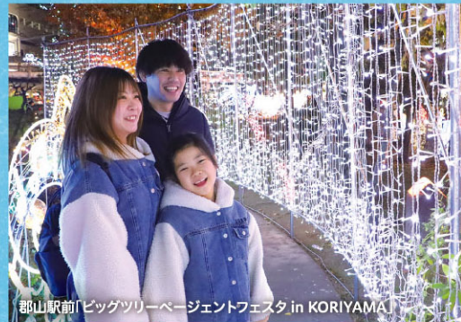
郡山駅前「ビッグツリーページェントフェスタ in KORIYAMA」