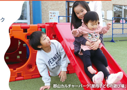
郡山カルチャーパーク「屋内子どもの遊び場」