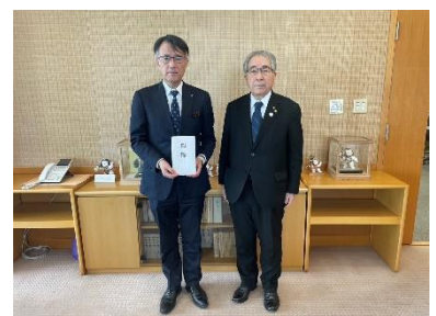
能登半島地震見舞金の贈呈