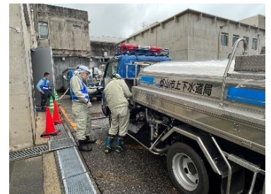
珠洲市総合病院での給水作業