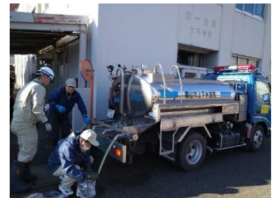
七尾市での給水活動