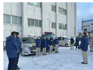
七尾市への給水活動に出発