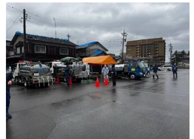
七尾市での給水活動