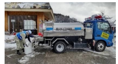
若山小学校での給水作業