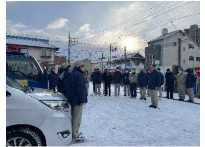
七尾市への給水活動に出発 「給水車出発式」