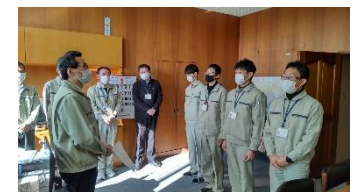
七尾市への給水活動に出発