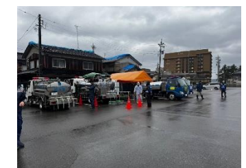
七尾市での給水活動