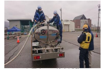
七尾市での給水活動