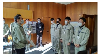
七尾市への給水活動に出発 「出発式」