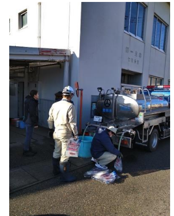
七尾市での給水活動