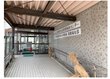
石川県能登北部保健福祉センター