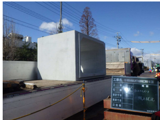
ボックスカルバート搬入状況