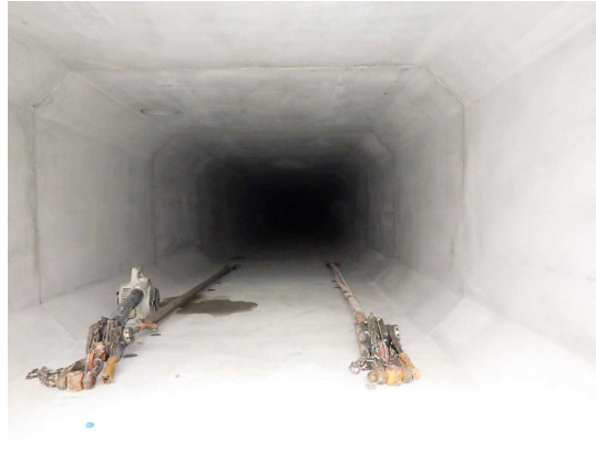
ボックスカルバート布設完了