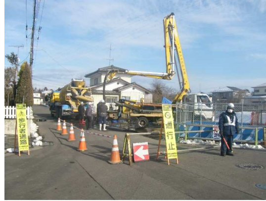
頂版コンクリート打設状況