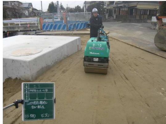
特殊人孔埋戻し状況