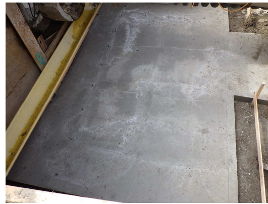
基礎コンクリート完了