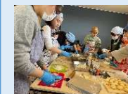
スペイン料理教室