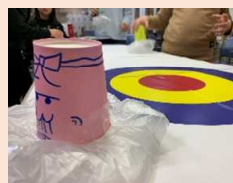
プログラム カーリングの様子