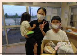
ハコいっぱい頂いて