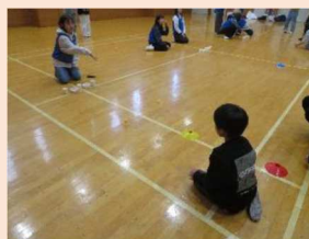
冬の野外体験活動