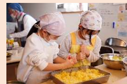
調理の様子 お子さんと一緒に活動しています。