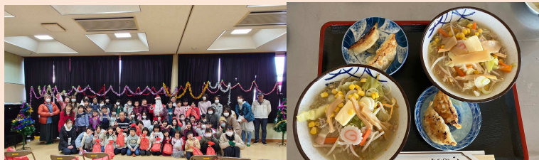
左:クリスマス交流会集合 右:2/10 特製味噌ラーメンと餃子のランチ

・毎回10~15名程のスタッフが朝9時からランチの調理やゲームの準備を進め、9時半頃から参加者の受付をします。モノづくり体験やゲームなどで交流を深めた後、23年4月からはみんなで食卓を囲んでランチを楽しんでいます。参加は予約制ですが人員の上限規制は行っていません。