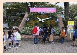
電車バスでの外出の様子