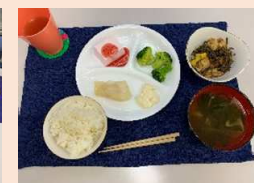
夕食(白身魚タルタル、和え物、春雨スープ、ごはん、いちごムース)