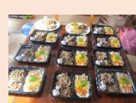
6/22 いただきます 7/20 地域の夏祭り 12/22 地域のクリスマス 1/27 恵方巻 3/24 三食ご飯