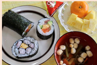
立春こづゆと太巻きメニュー