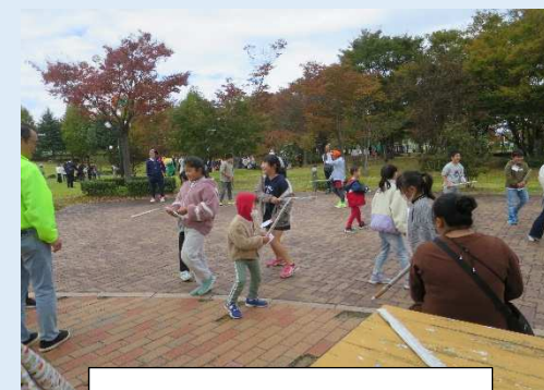
新聞紙チャンバラゲーム