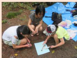
夏の野外体験活動

運営メンバーは母子家庭の母。大学生のボランティアによる無料学習支援 大学生ボランティアとの冬の交流会