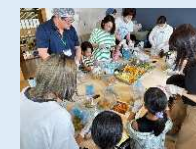
梅シロップ作りws開催