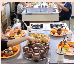
ハロウィンメニュー

メニューごとに担当を決めて、みんなで楽しく安全に調理ができるように心がけています。