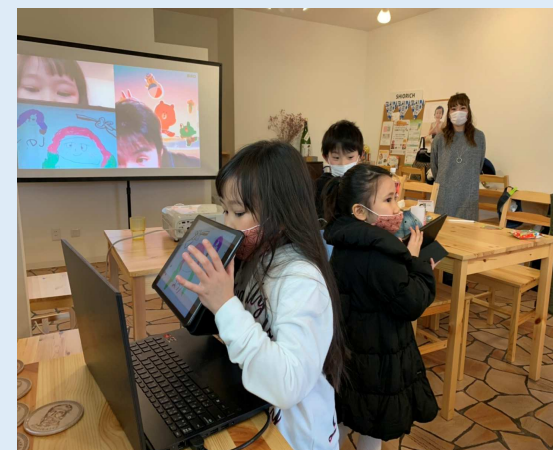
Ipad 利用で動画制作など子供の居場所作り