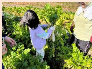
秋の野外体験活動