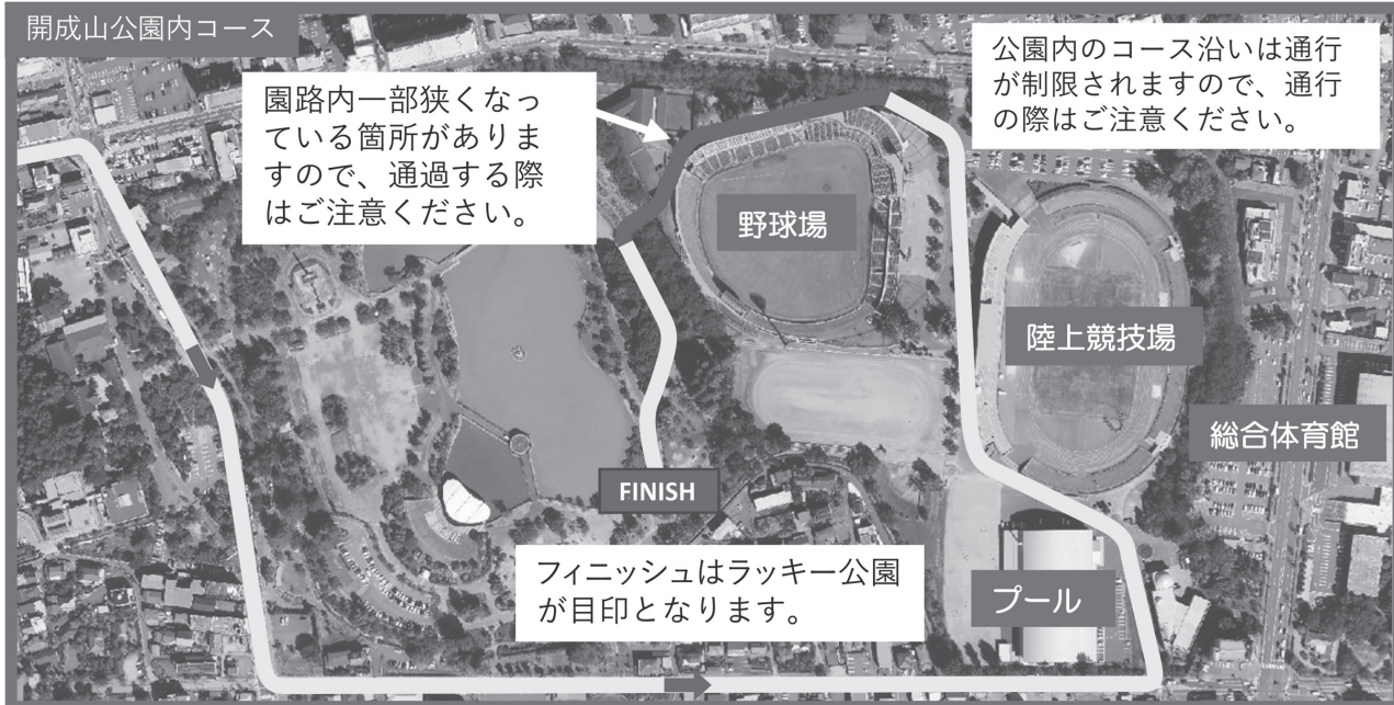
開成山公園内コース