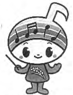
郡山市イメージキャラクター がくとくん