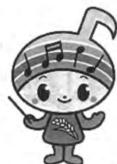
郡山市イメージキャラクター がくとくん