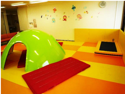
築山とジャンピングマット