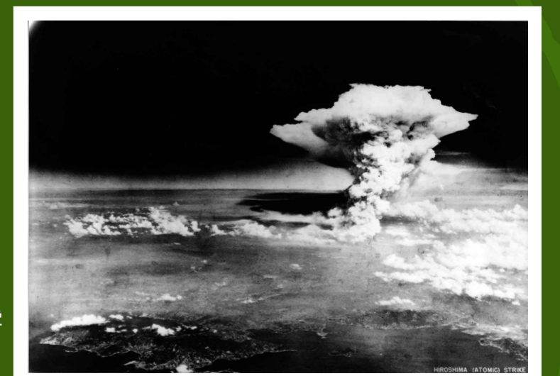
米軍機より撮影したきのこ雲