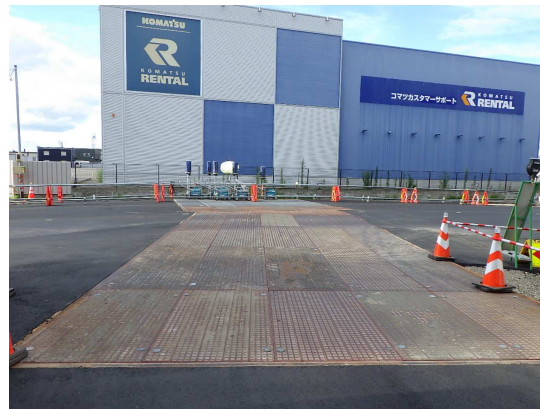
大河原線 覆工板設置完了