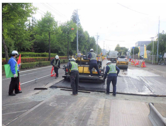
133号 雨水管布設部舗装仮復旧状況