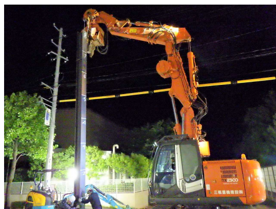
大河原線 親杭 (H鋼) 打込み状況