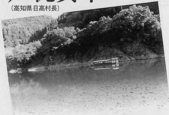
仁淀川をゆく観光屋形船