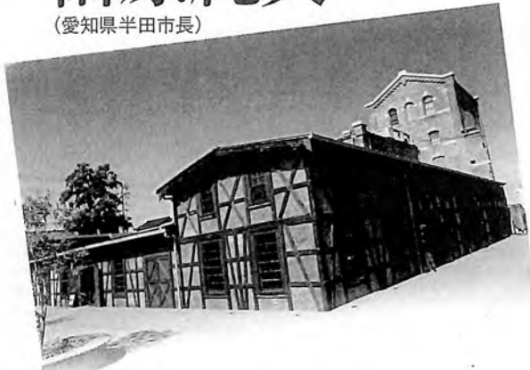
半田赤レンガ建物