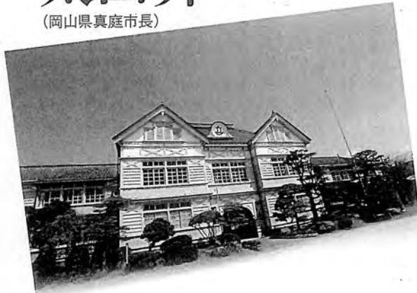
旧遷喬小学校校舎