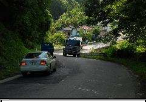
主要地方道 本宮三春線 (L≒300m)