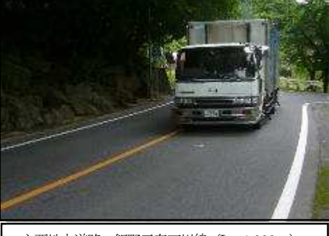
主要地方道路 飯野三春石川線 (L≒1,000m)