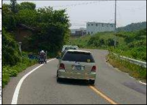
主要地方道路 川俣安達線 (L≒1,000m)