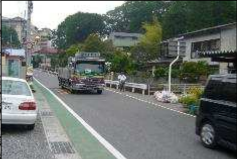
主要地方道 古殿須賀川線 (L≒3,300m)