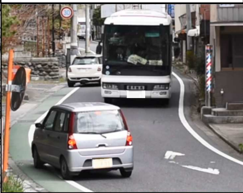
3-① 玉川村大字南須釜地内 石川町大字母畑地内拡幅改良整備