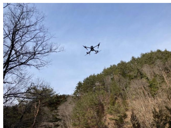
ドローン飛行イメージ