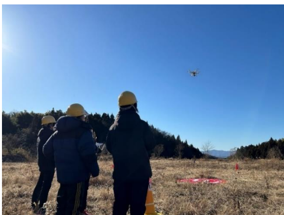
ドローン操作イメージ

農地の遊休化は、限られた資源である農地の活用、近隣の農地利用への影響等があり、今後の農業振興を図る上でその解消を図ることが重要であることから、農地法第30条第1項の規定に基づき、毎年、農地の利用状況調査を実施している。