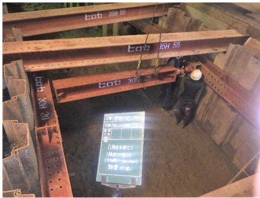
掘削及び切梁設置状況