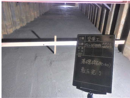
基礎砕石施工完了