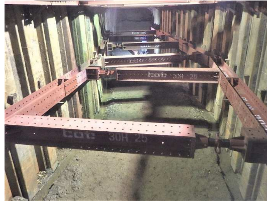
切梁設置、床掘完了