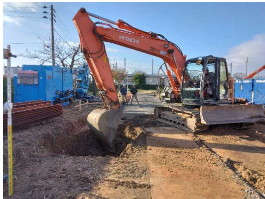
鋼矢板圧入箇所布掘り状況