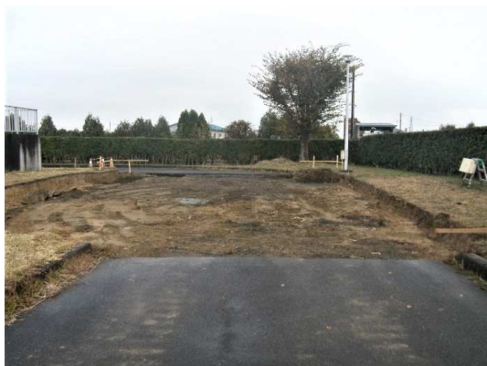
既設舗装版撤去完了

11月は、既設舗装版撤去、布掘り及び鋼矢板圧入などを行いました。 12月は、地盤改良のための薬液注入及び掘削などを行います。