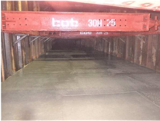
基礎コンクリート打設完了

11月は、基礎コンクリート及びボックスカルバート布設を行いました。 12月は、引き続き、基礎コンクリート及びボックスカルバート布設を行います。