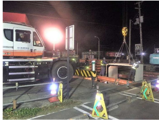
ボックスカルバート布設状況