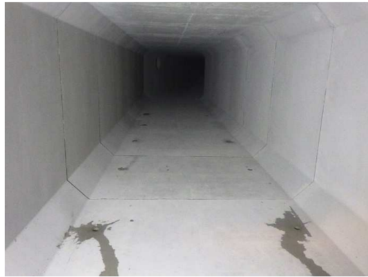
ボックスカルバート布設完了