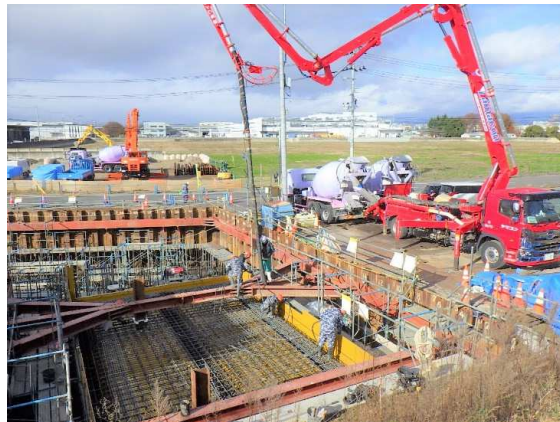
ポンプ施設部コンクリート打設状況