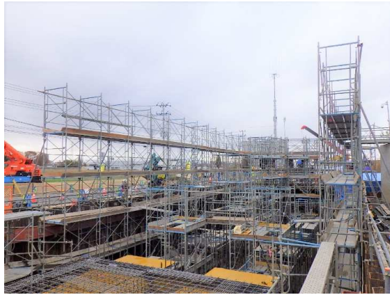
ポンプ施設部足場施工状況