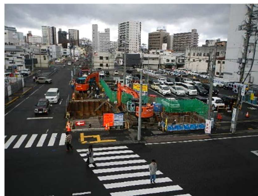
フーチング基礎工施工状況(全景)