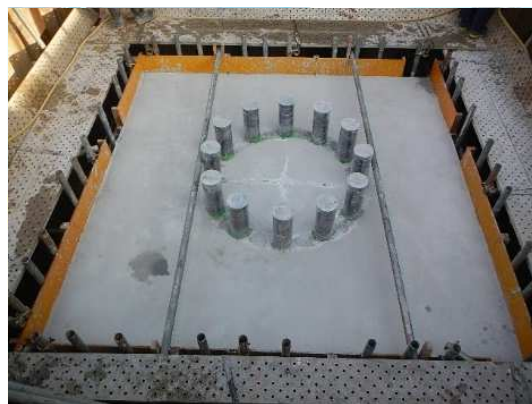
フーチング基礎工(コンクリート打設完了)施工状況(N-P2)