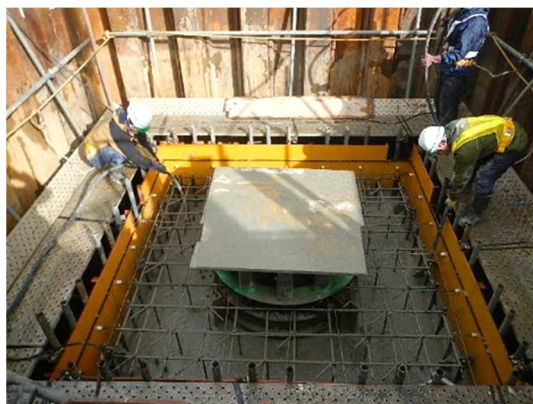
フーチング基礎工(コンクリート打設)施工状況(N-P2)

11月は、ペDESTロリアンデッキのフーチング基礎工(計4箇所)の施工に着手しました。 12月は、引き続き、フーチング基礎工の施工を行います。