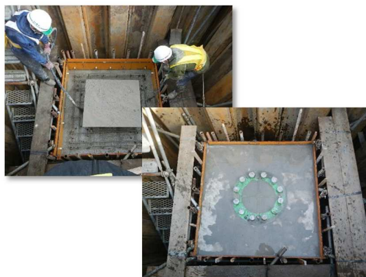
フーチング基礎工(コンクリート)施工状況(N-KP1)