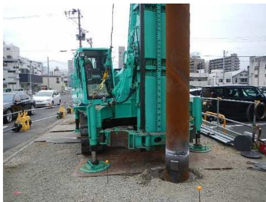
小口径回転杭工施工状況