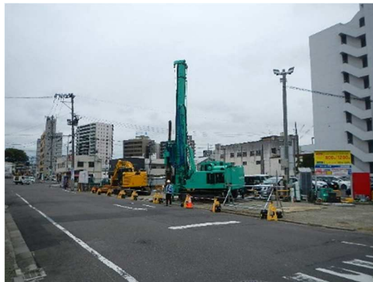
小口径回転杭工施工状況(北西側を望む)