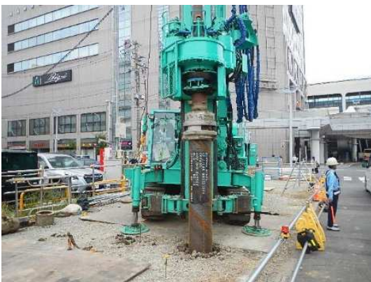
小口径回転杭工施工状況