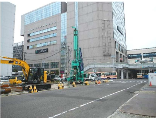
小口径回転杭工施工状況(北東側を望む)

9月は、都市計画道路日の出通り線北側におけるペDESTロリアンデッキの基礎杭(小口径回転杭工 \phi 400\text{mm} 、 L=26.0\text{m} 、 N=12 本(4本/箇所))設置に着手しました。 10月は、引き続き、基礎杭設置を行います。