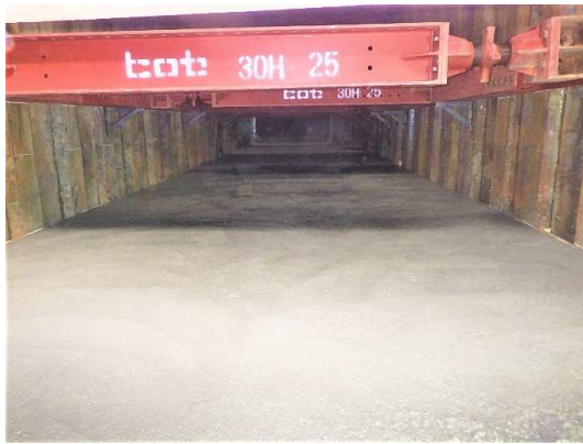
基礎コンクリート打設完了