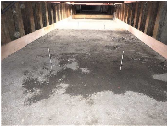
掘削及び基礎砕石完了

12月は、掘削及び基礎コンクリート打設などを行いました。 1月は、ボックスカルバート布設などを行います。