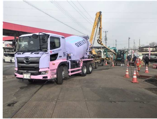
基礎コンクリート打設状況