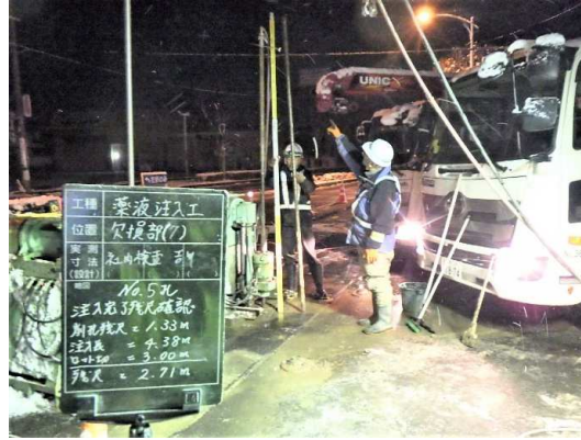
地盤改良のための薬液注入工施工状況