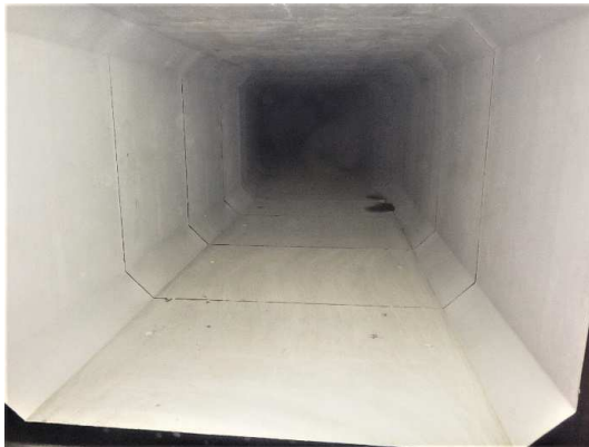
ボックスカルバート布設完了