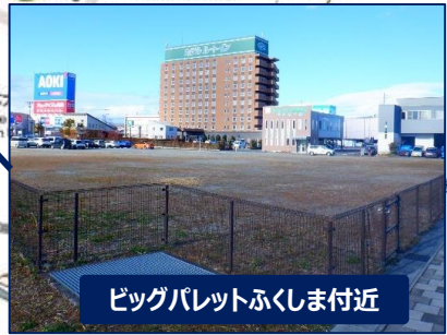
ビッグパレットふくしま付近