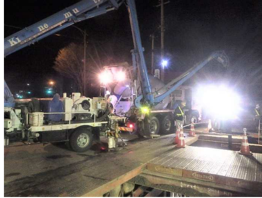
基礎コンクリート打設状況