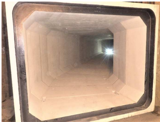
ボックスカルバート布設完了