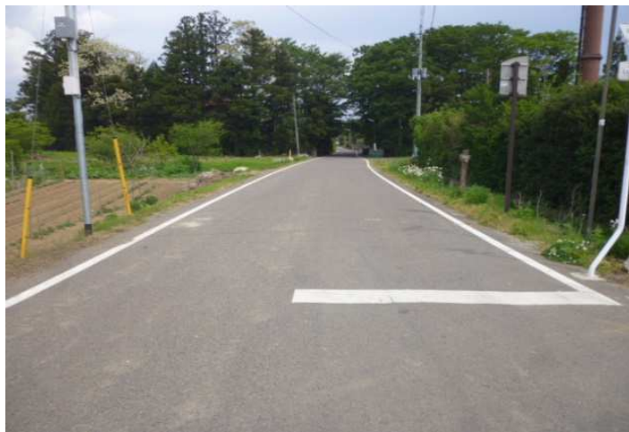
対 策 前