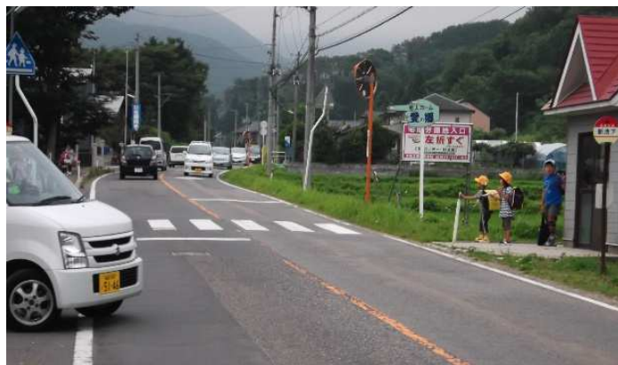
対 策 前