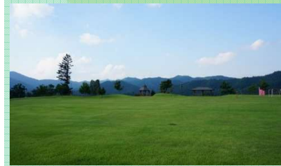
町民憩いの森公園

☎ 古殿町産業振興課 0247-53-4620 見どころ/芝生広場、遊歩道、バーベキューが楽しめる里山広場がある。