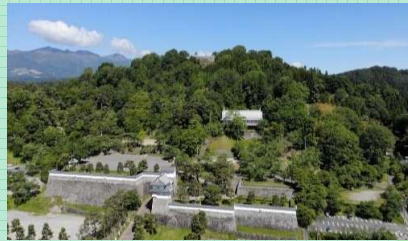
霞ヶ城県立自然公園

☎ 二本松市都市計画課 0243-55-5130 見どころ/山頂の石垣から市内を一望。四季折々の自然と二本松城の歴史が楽しめる。