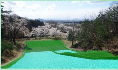
ふれあいの森公園

☎ 鏡石町産業課 0248-62-2118 見どころ/自然あふれる園内で人工芝滑り台やBBQが楽しめる。春は桜もおすすめ。