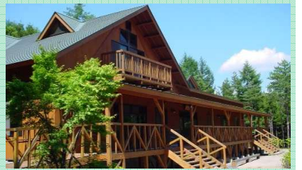
緑とのふれあいの森公園

☎ 小野町産業振興課 0247-72-6938 見どころ/キャンプ、マウンテンバイク、バーベキューなどが楽しめる。(4/1~11/30)