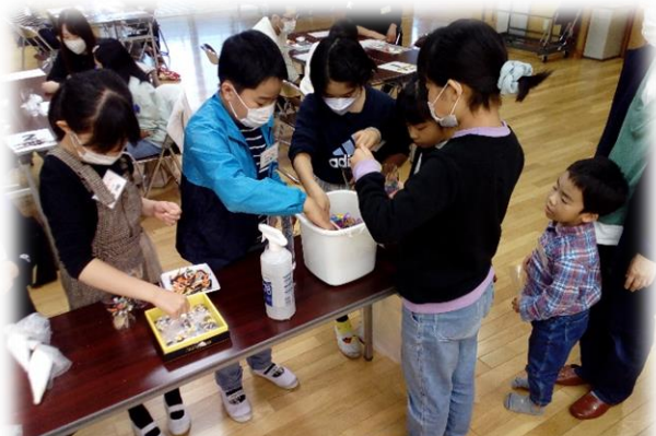
土台のゼリーの部分をすくって、カップに入れたり