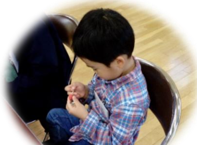
爪楊枝で苺をチクチクチクしたり