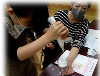
生クリームをぎゅーっと絞ったり