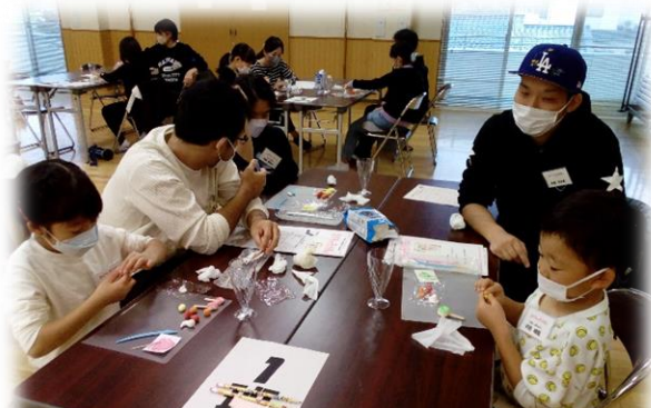
お父さんたちは、その様子をじっと見守っています