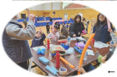
← バルーンでロケットを作ったよ。