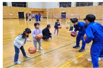
↑ 安積中バスケット部の生徒から、 バスケットを教わっている様子。