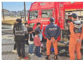
← 消防車両も見学。 かっこよかった～！

今年は、バルーンアート、けん玉、木工体験教室や消防車両見学のほか、安積中学校から、「野球部・バスケットボール部・卓球部・バドミントン部」の生徒の皆さんが応援に駆けつけ、各種競技を教えてくださいました。安中生の先輩方、ありがとうございました。