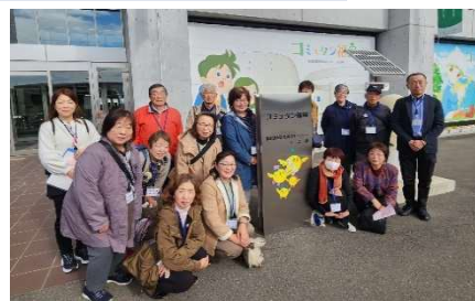
コミュタン福島入口

「コミュタン福島」では、東日本大震災からの福島の復興の様子、「荒井浄水場」では、水道水のできるまでをそれぞれ職員の方からご説明をいただき貴重な施設見学となりました。