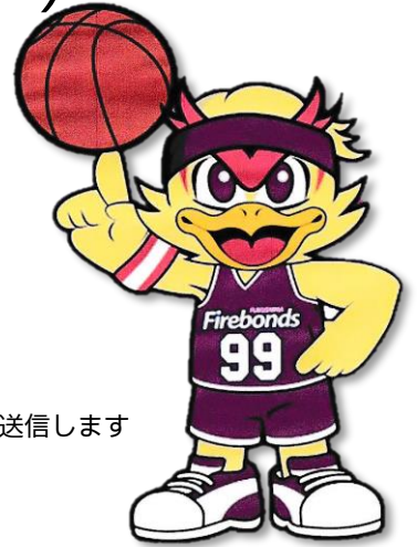
福島ファイヤーボンズ オフィシャルキャラクター ボンズくん