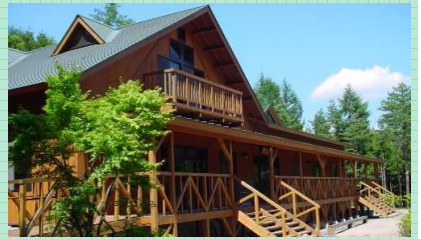
緑とのふれあいの森公園

☎ 小野町産業振興課 0247-72-6938 見どころ/キャンプ、マウンテンバイク、バーベキューなどが楽しめる。(4/1~11/30)