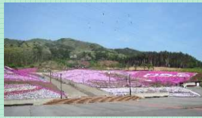
ジュピアランドひらた

☎ 平田村産業振興公社 0247-55-3557 見どころ/春の満開時は、約25万株もの芝桜が花の絨毯を敷き詰めたように美しい。