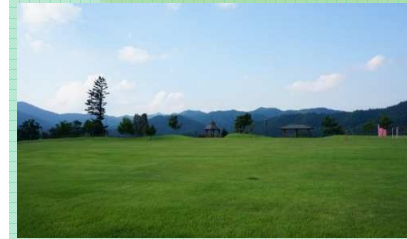
町民憩いの森公園

☎ 古殿町産業振興課 0247-53-4620 見どころ/芝生広場、遊歩道、バーベキューが楽しめる里山広場がある。