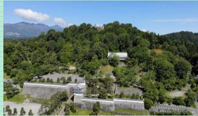
霞ヶ城県立自然公園

☎ 二本松市都市計画課 0243-55-5130 見どころ/山頂の石垣から市内を一望。四季折々の自然と二本松城の歴史が楽しめる。