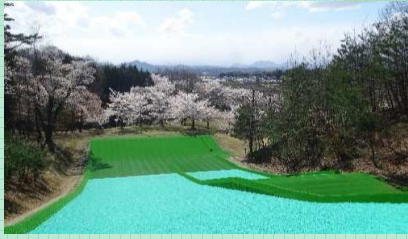
ふれあいの森公園

☎ 鏡石町産業課 0248-62-2118 見どころ/自然あふれる園内で人工芝滑り台やBBQが楽しめる。春は桜もおすすめ。